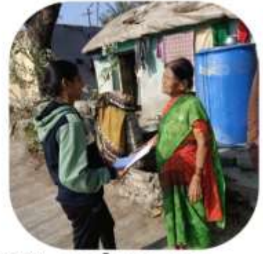
Day 4 :- exercise, village survey and sports