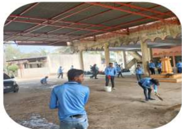
Day 1 - temple cleaning and leaders guidance