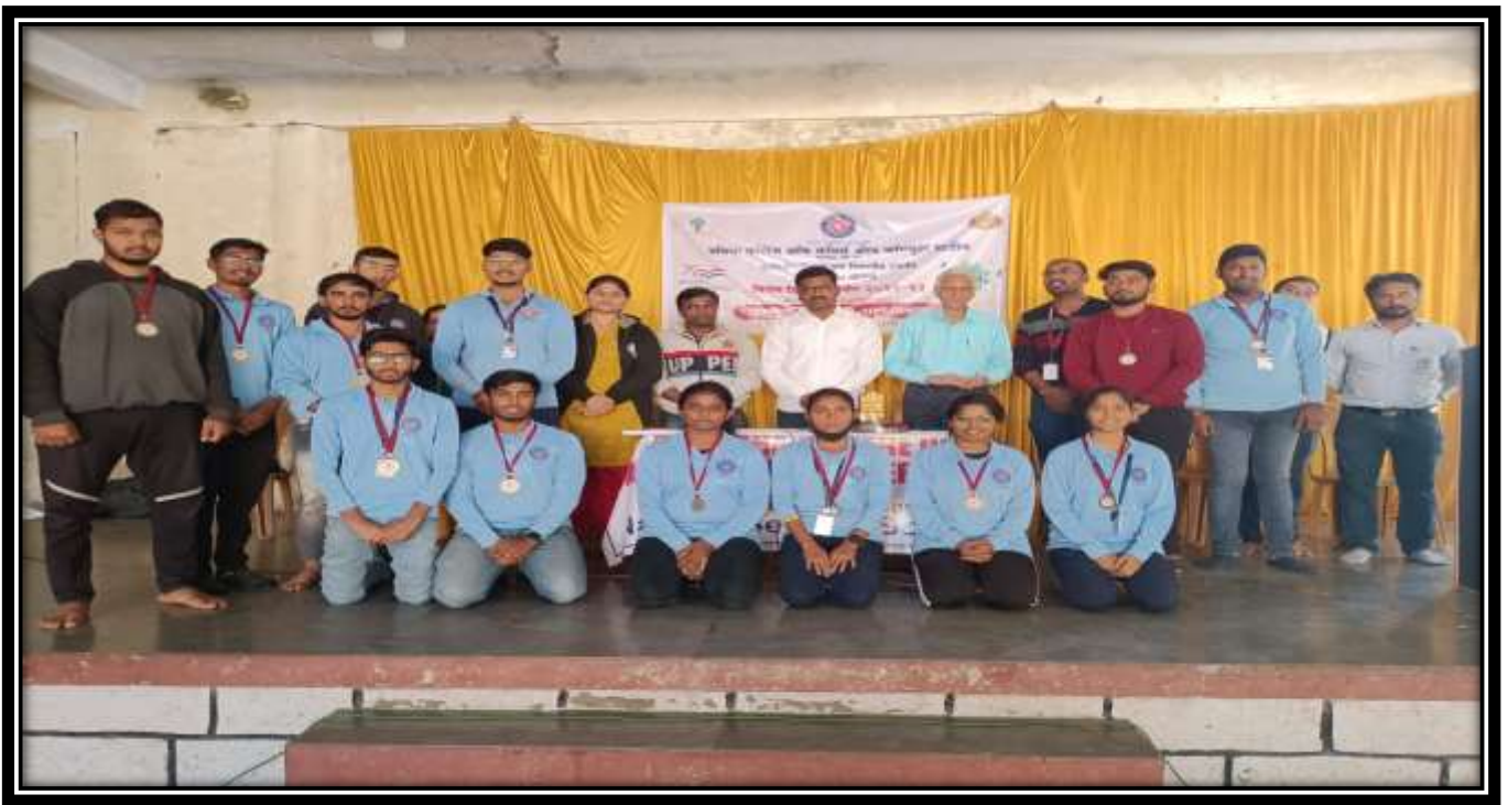
2) State Level Camp I ( 16/02/2023 to 22/02/2023)