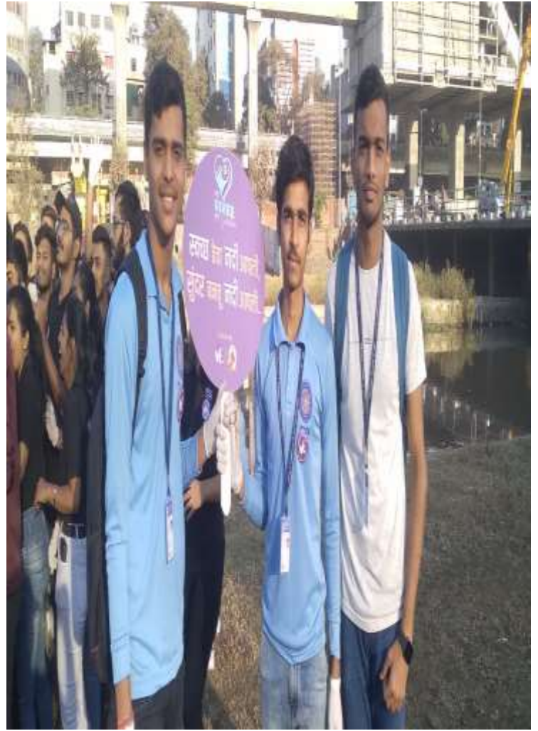
17) SEVA SARTHI FOUNDATION ( 12/02/2023)