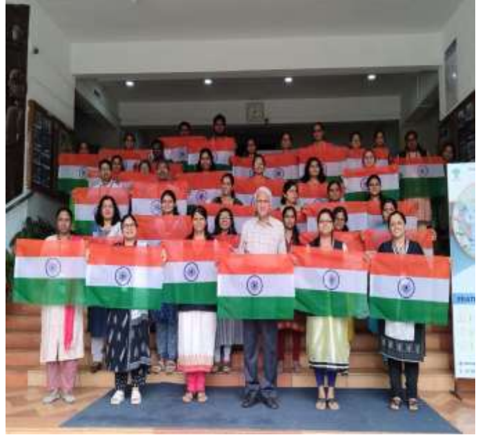
Staff holding flag