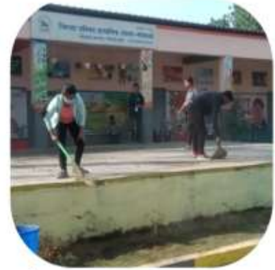
Day 3 - Exercises, cleaning