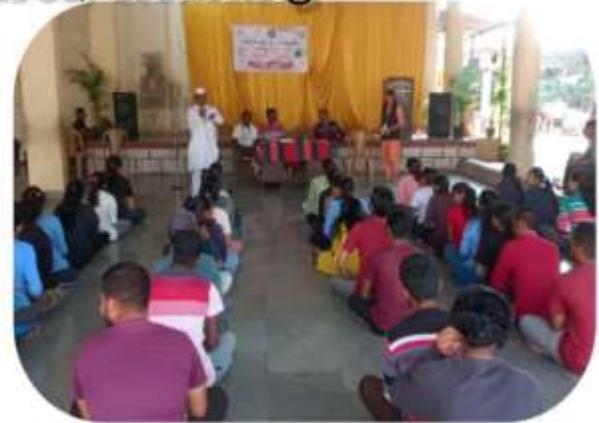
guidance and village rally