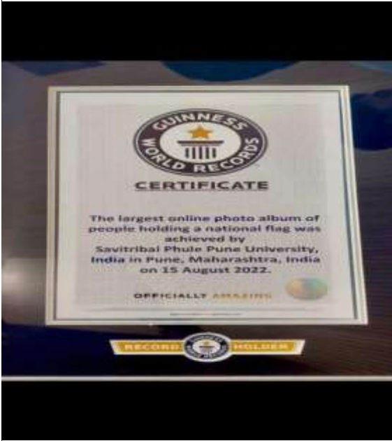
Certificate of Guinness world record